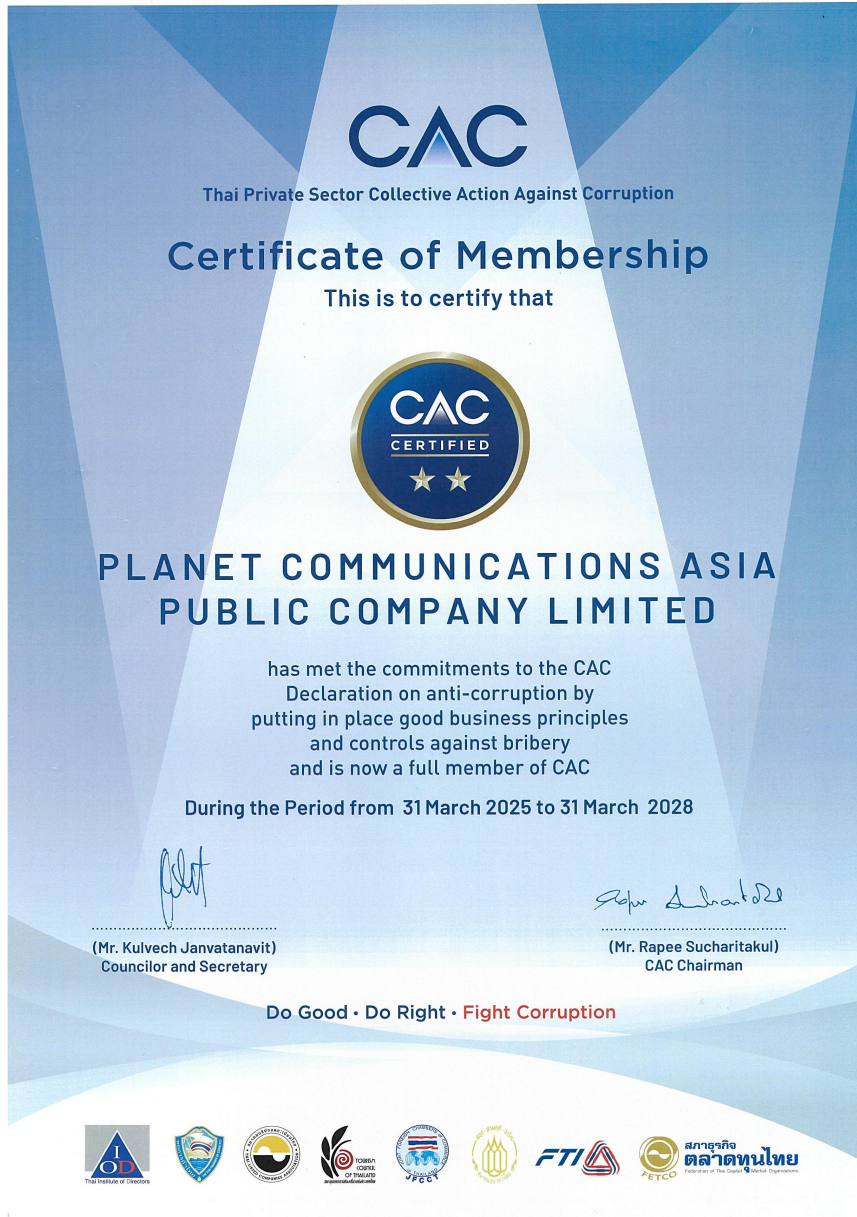
CAC Certificate of Membership

ข้อมูลเกี่ยวกับการเปลี่ยนแปลงและพัฒนาการที่สำคัญของนโยบายแนวปฏิบัติและระบบการกำกับดูแลกิจการในรอบปีที่ผ่านมา การเปลี่ยนแปลงและพัฒนาการที่สำคัญเกี่ยวกับการทบทวนนโยบายและแนวปฏิบัติของระบบการกำกับดูแลกิจการ หรือกฎบัตรคณะกรรมการ